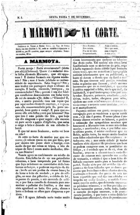
Figura 1: 1ª edição do Jornal