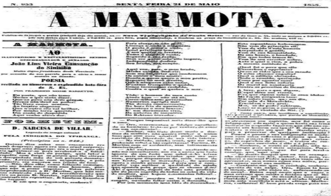
Figura 7: Diálogo em que D. Narcisa confronta o irmão D. Martim, edição 953.

Fonte Acervo Digital: da Biblioteca Nacional 17