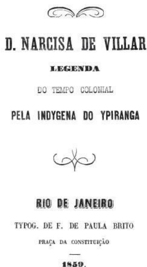
Figura 4: Capa do livro impresso um ano após a publicação no Jornal A Marmota

Fonte: Biblioteca Brasileira Guita e José Medlin 12