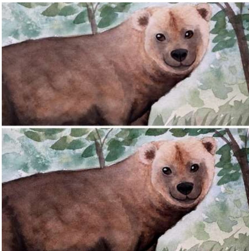
Figura 4 - Imagem superior, ilustração digitalizada sem edição. Imagem inferior, ilustração digitalizada e tratada no Adobe Photoshop.