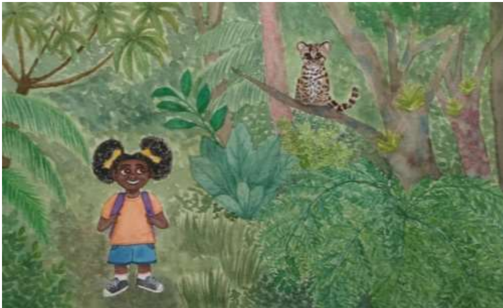
Figura 3 - Primeira ilustração realizada por Taty Vivian.