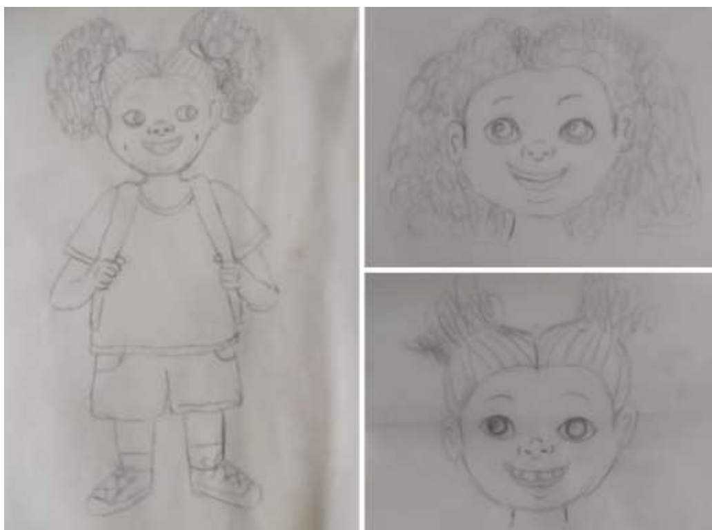
Figura 1 - Desenhos iniciais da protagonista humana do livro realizados por Taty Vivian

A primeira ilustração realizada serviu como uma forma de inspiração para a escrita da história e auxiliou na concepção dos personagens e na escolha de paisagens para representar o bioma Mata Atlântica.