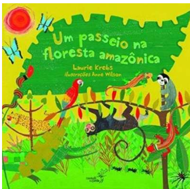
Figura 9 - Capa do livro Um Passeio na Floresta Amazônica . de Laurie Krebs