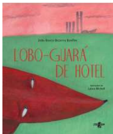
Figura 7 - Capa do livro Lobo-guará de hotel de João Bosco Bezerra Bonfim