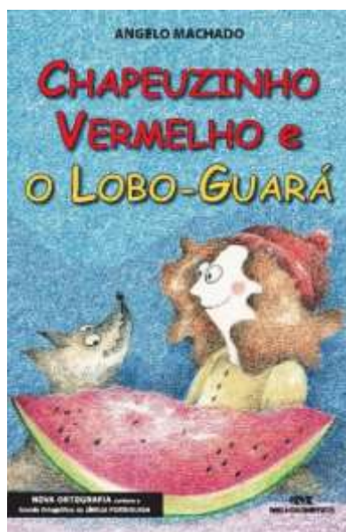
Figura 6 - Capa do livro Chapeuzinho vermelho e Lobo-Guará de Angelo Machado