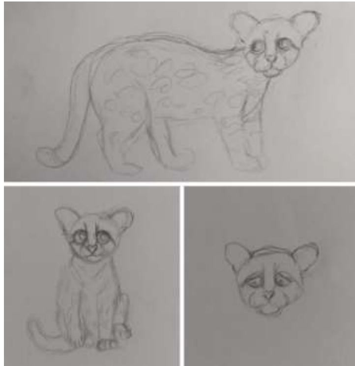
Figura 2 - Desenhos iniciais de um gato-macarajá, um dos animais protagonistas do livro, realizados por Taty Vivian.