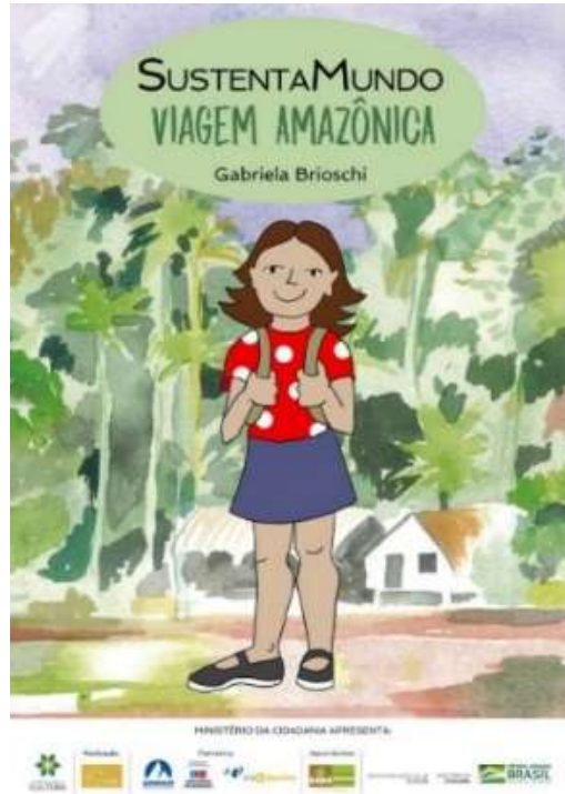
Figura 10 - Capa do livro SustentaMundo Viagem Amazônica de Gabriela Brioschi.