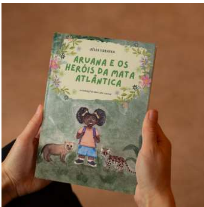
Figura 11 – Imagem de divulgação do livro Aruana e os Heróis da Mata Atlântica .

Segundo Scalfi (2014), a maior parte dos livros infantis com a temática da fauna brasileira estão indisponíveis ou esgotados para compra. Além desse problema, professores podem apresentar limitações em sala de aula para tratar dessa temática com os alunos por conta da escassez de recursos, ou seja, poucos livros à disposição para a realização de atividades com essa temática. Por isso, o livro Aruana e os Heróis da Mata Atlântica está disponível gratuitamente no formato e-book para todos que tiverem interesse no site do Instituto Gaúcho de Estudos Ambientais (InGá) .