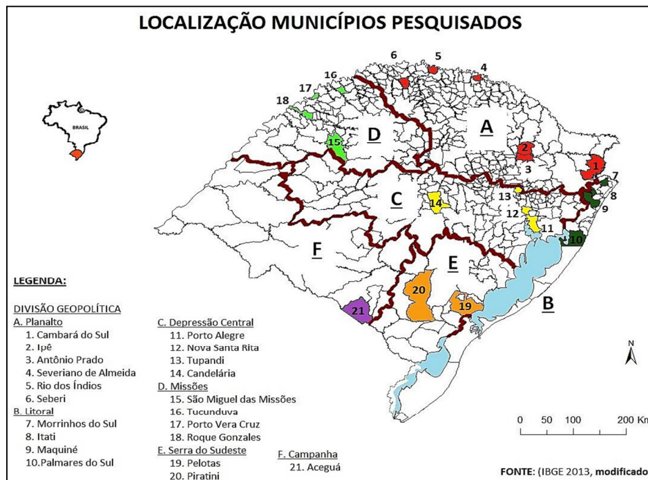
Figura 2: Municípios do Rio Grande do Sul com a presença de agroflorestas sistematizadas pelo projeto Fortalecimento das Agroflorestas no Rio Grande do Sul: formação de redes, etnoecologia e segurança alimentar e nutricional.

I Seminário de Desenvolvimento Territorial Sustentável da Região Sul III Encontro Região Sul de Etnobiologia e Etnoecologia III Seminário de Frutas Nativas do RS II Seminário das Agroflorestas do RS III Nhemboaty Mbya Kuery: teko ojevy angua regua, yy e'ëregua