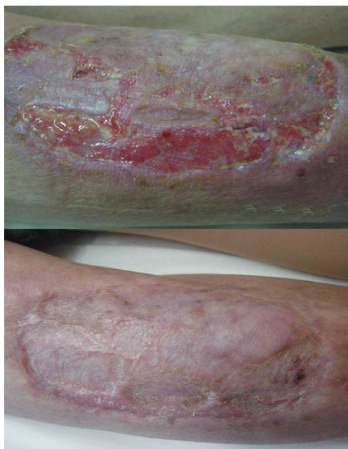
FIGURA 1: Acima, úlcera extensa, com pequena ulceração circunjacente, no membro inferior direito; Abaixo, resultado terapêutico após uso do voriconazol endovenoso

Em 2002, o National Committee for Clinical Laboratory Standards publicou normalização baseada em estudos com fungigramas, demonstrando ser esse fungo