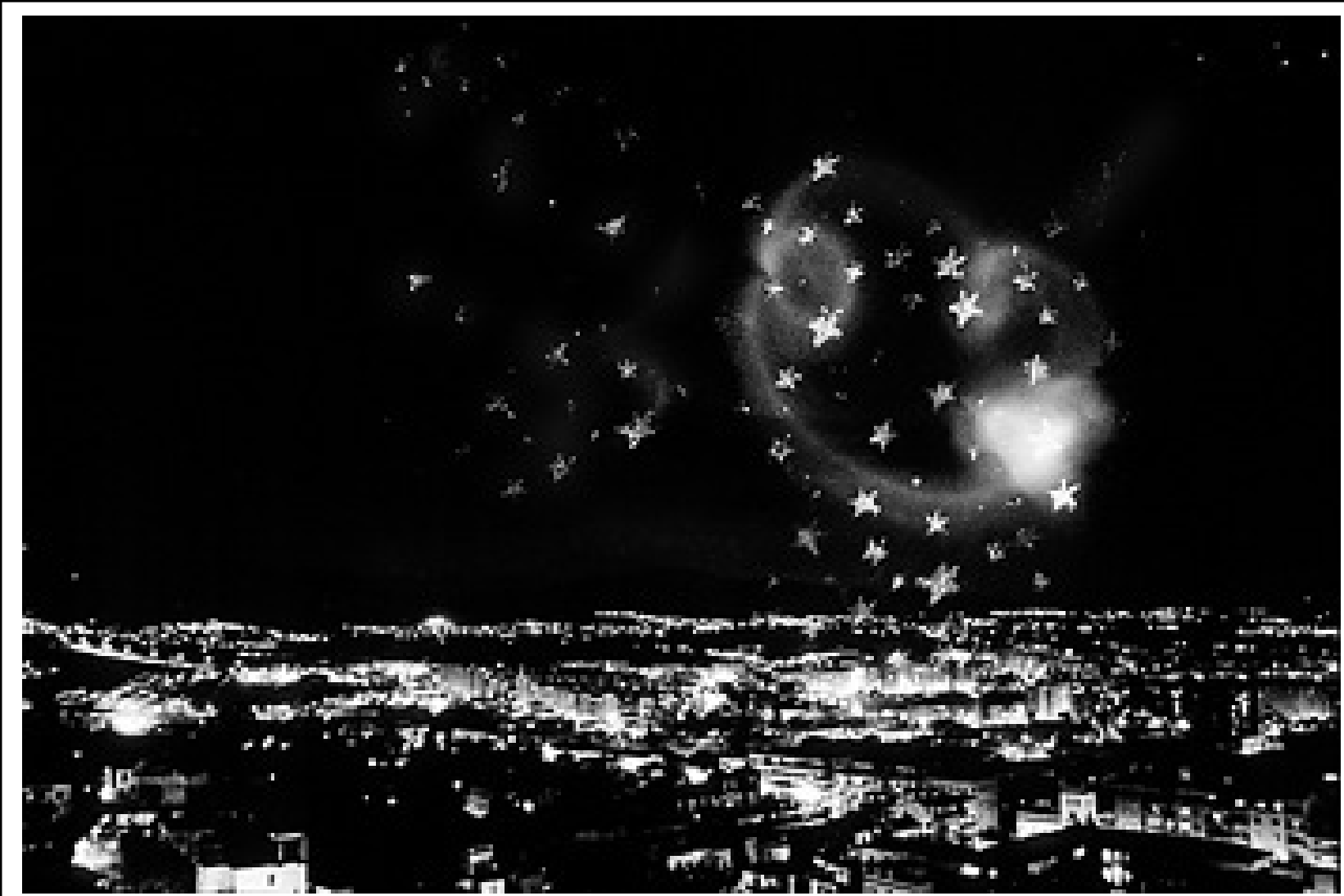
Ginebra con estrellas