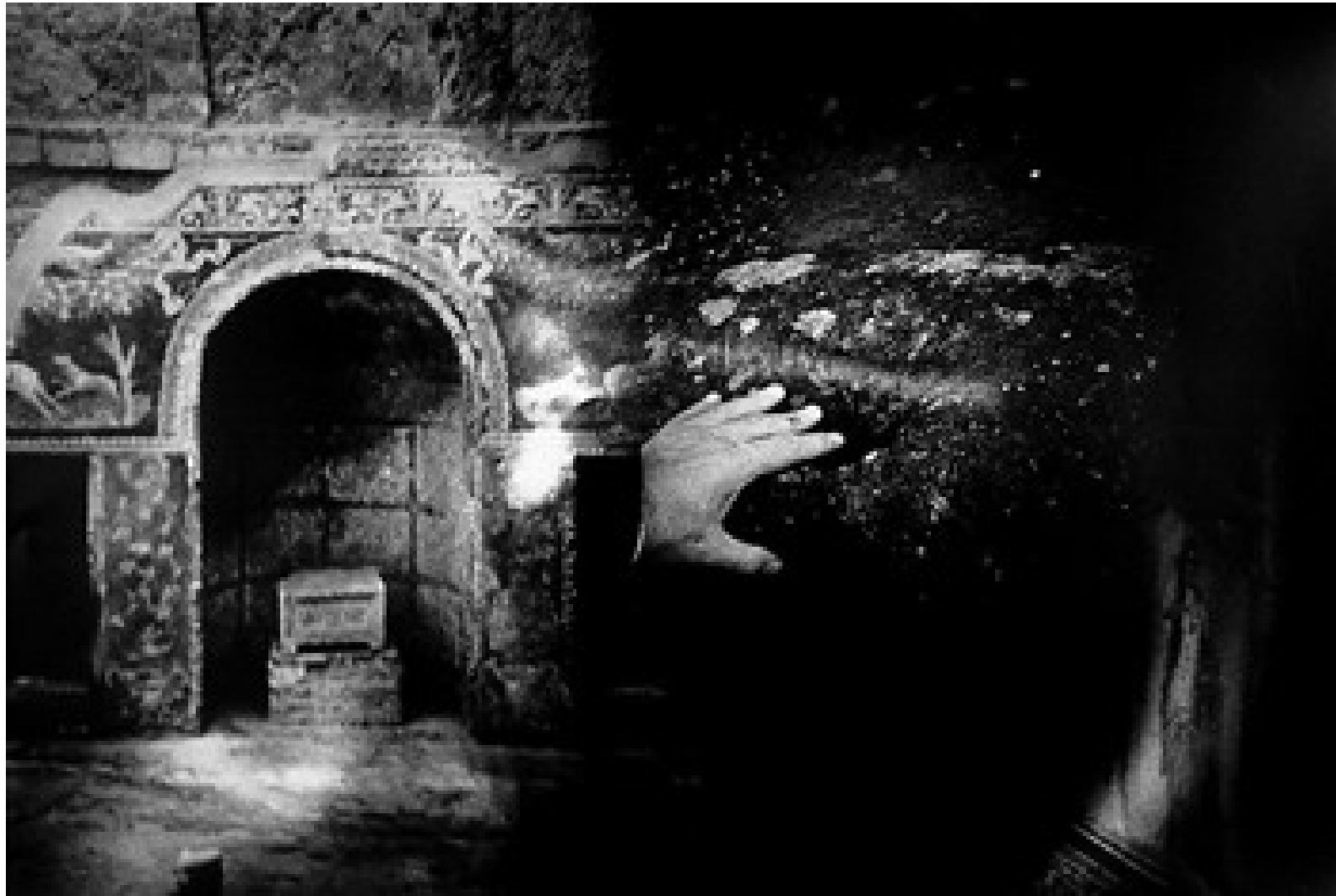
La mano sobre la piedra, Pompeya.