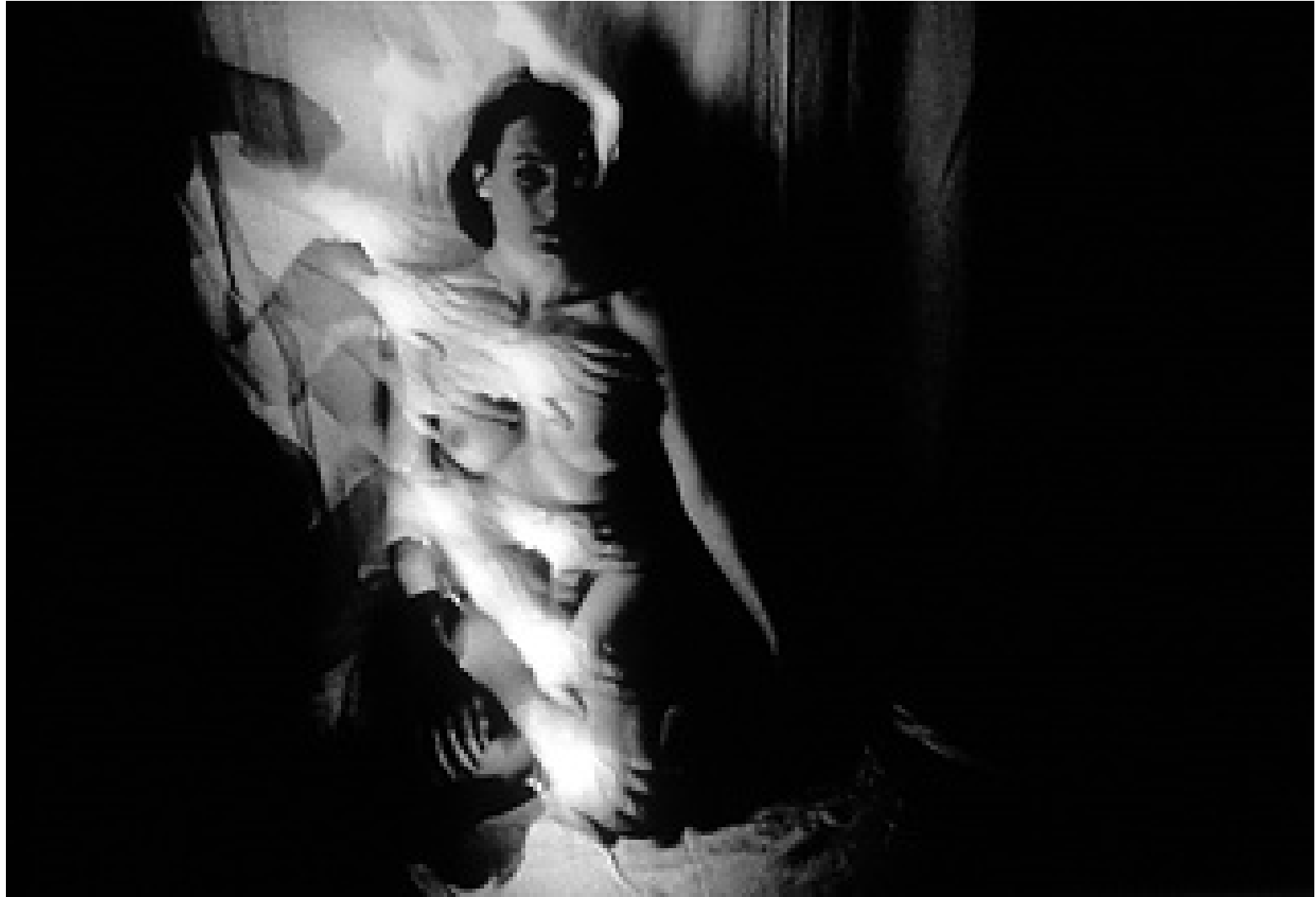
Desnudo con manos