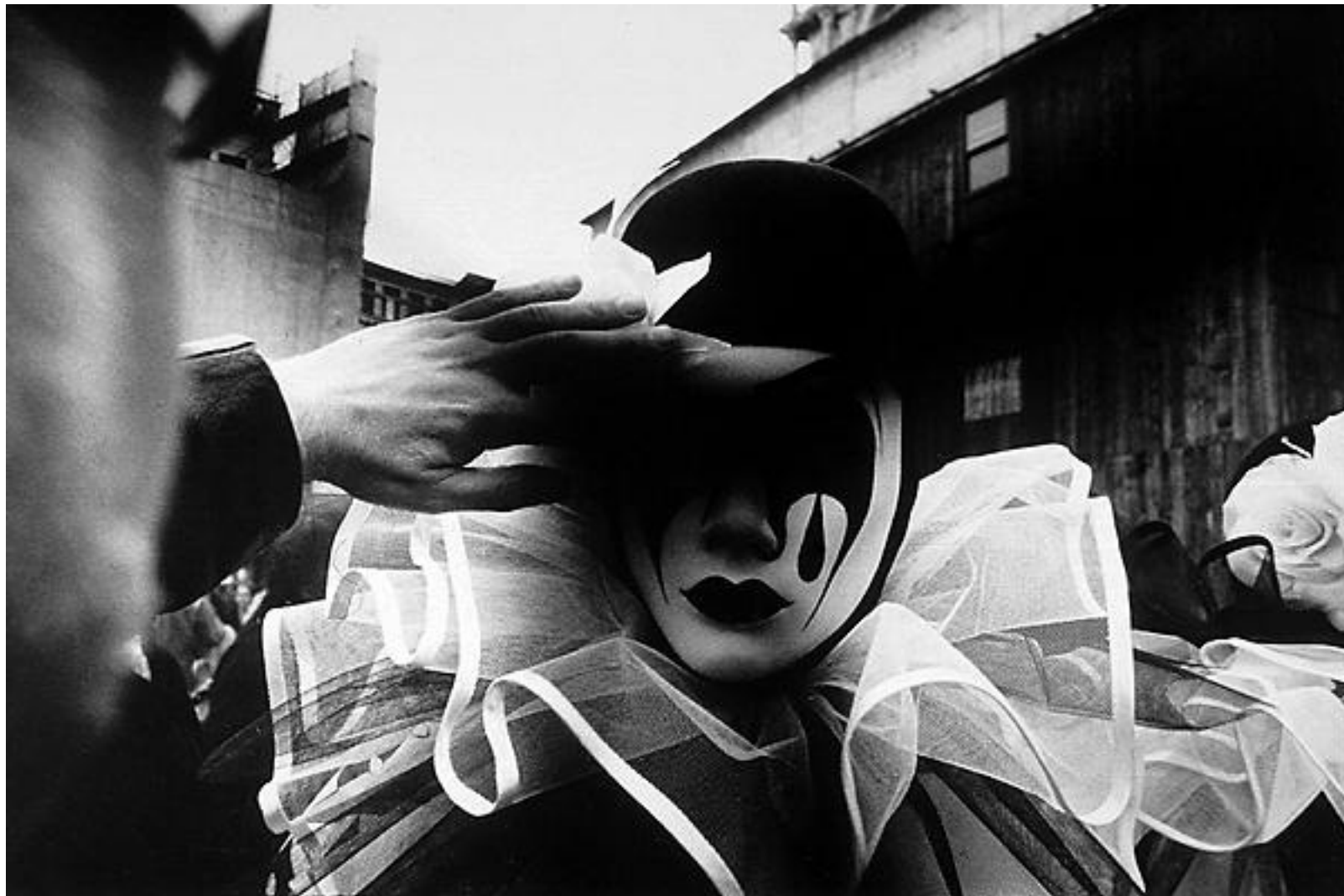
Máscaras en Venecia