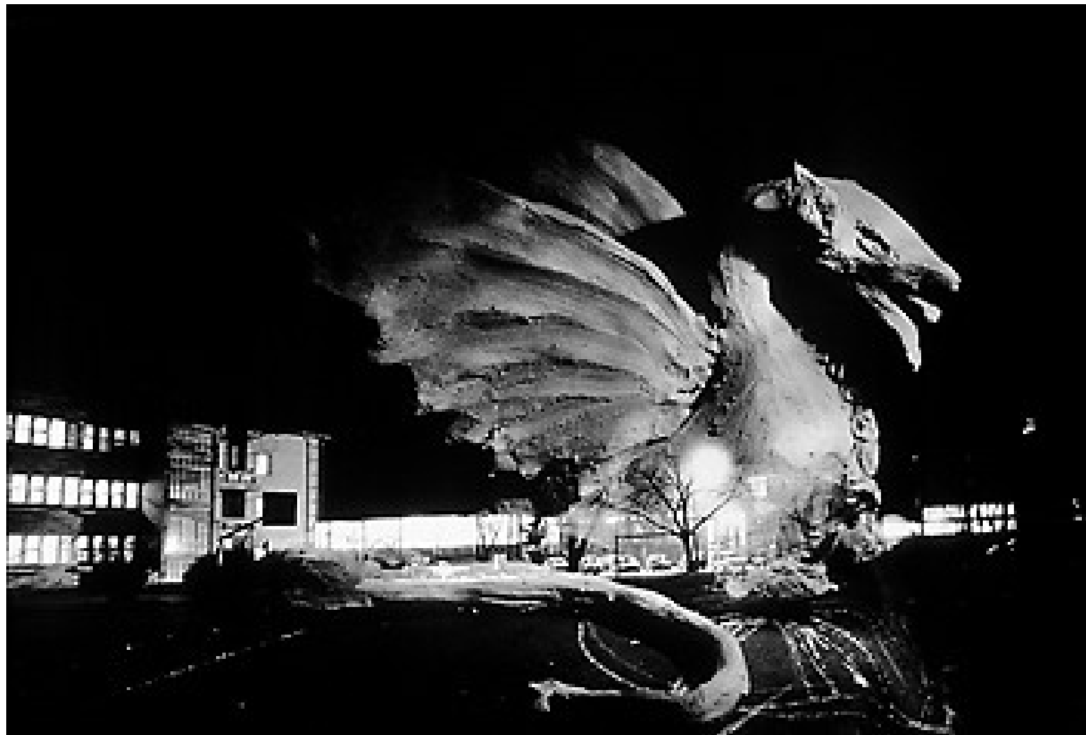
Liubliana con el dragón