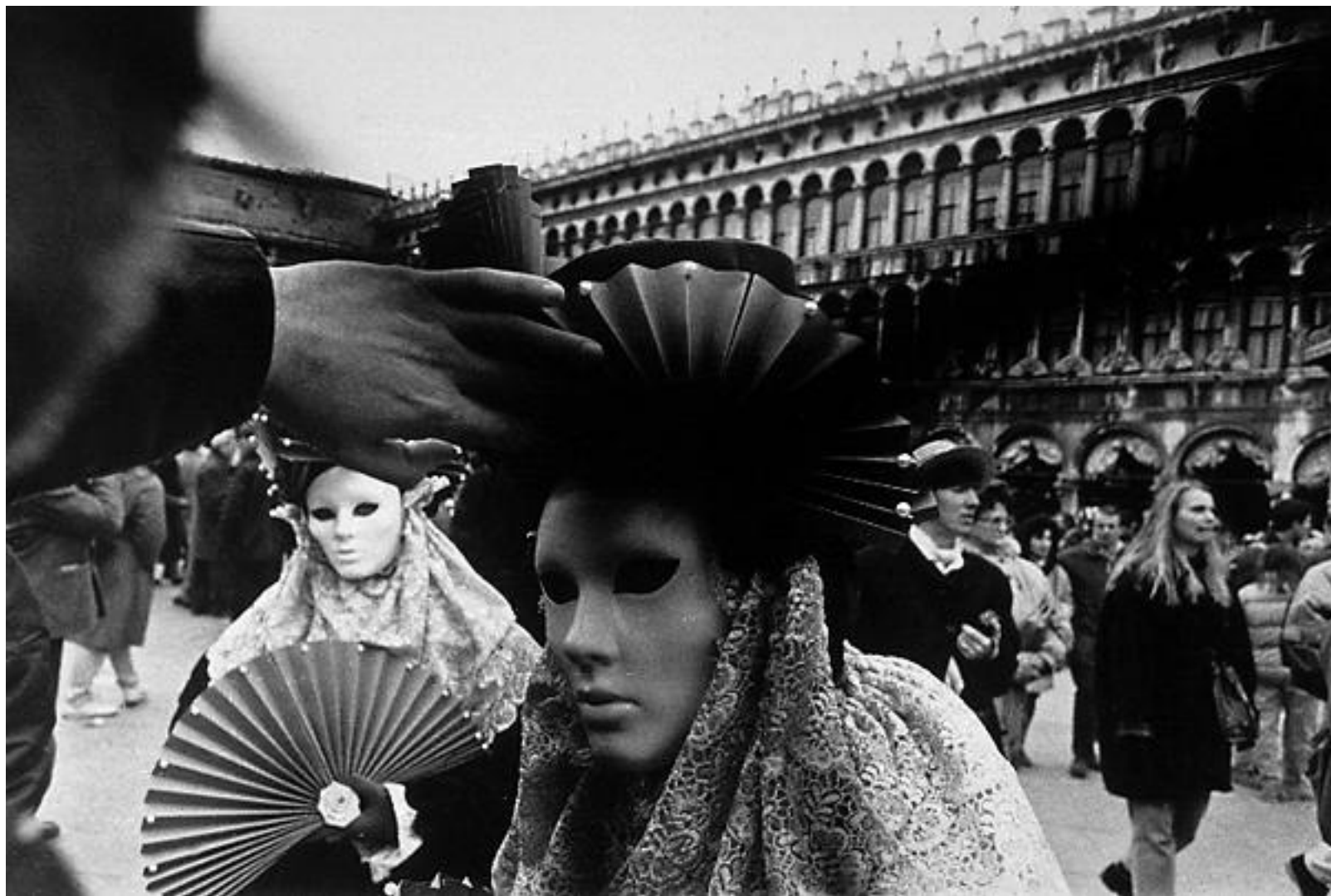
Máscaras en Venecia