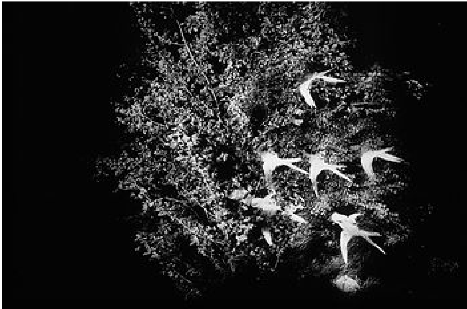
Árbol con golondrinas