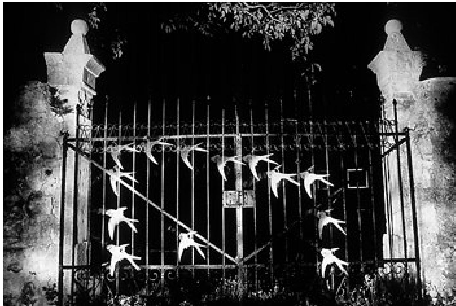
La puerta con golondrinas