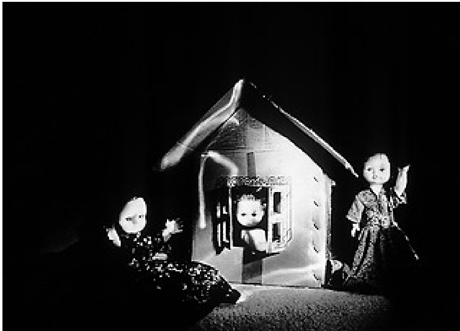
Caja de cartón con muñecas