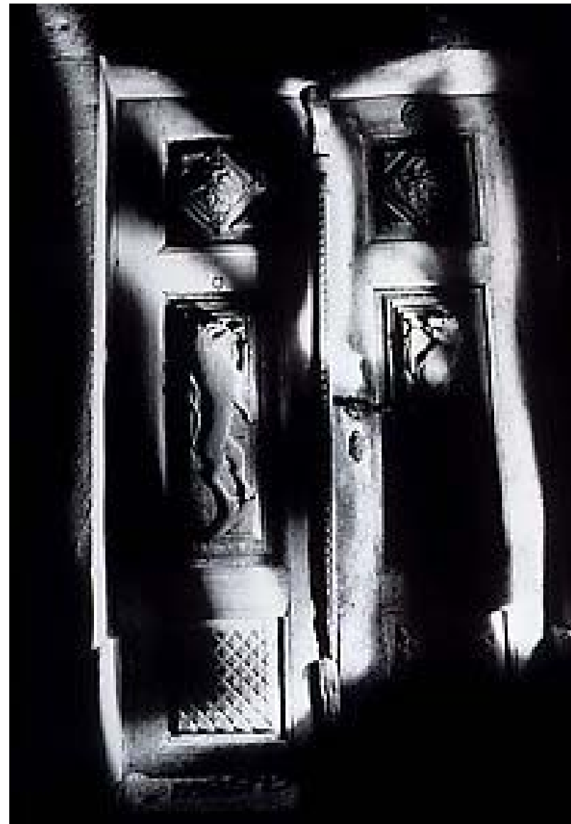
La puerta de Fuzine