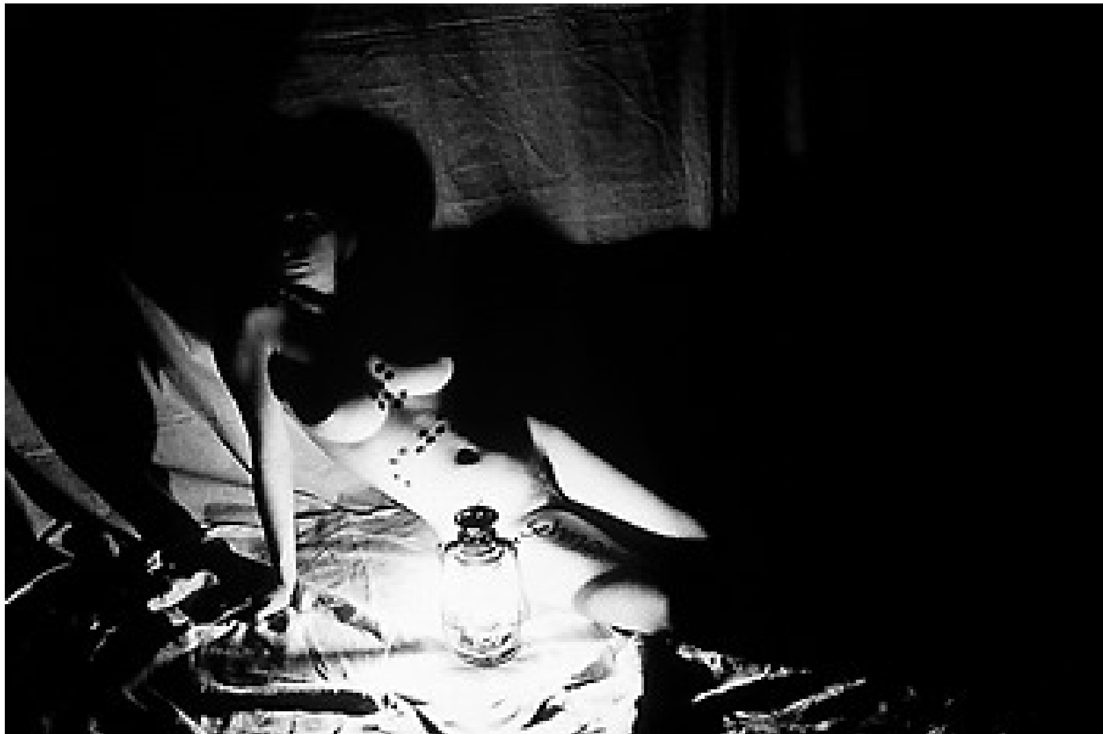
Desnudo con linterna