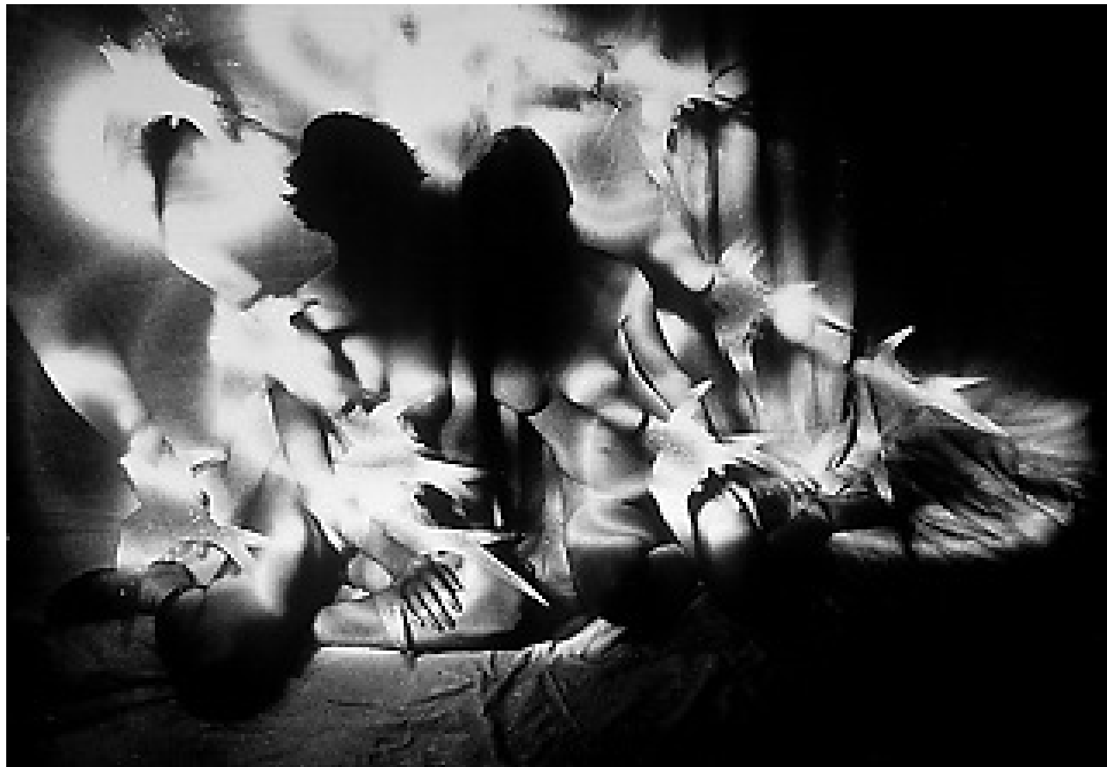
Desnudo a dos y golondrinas