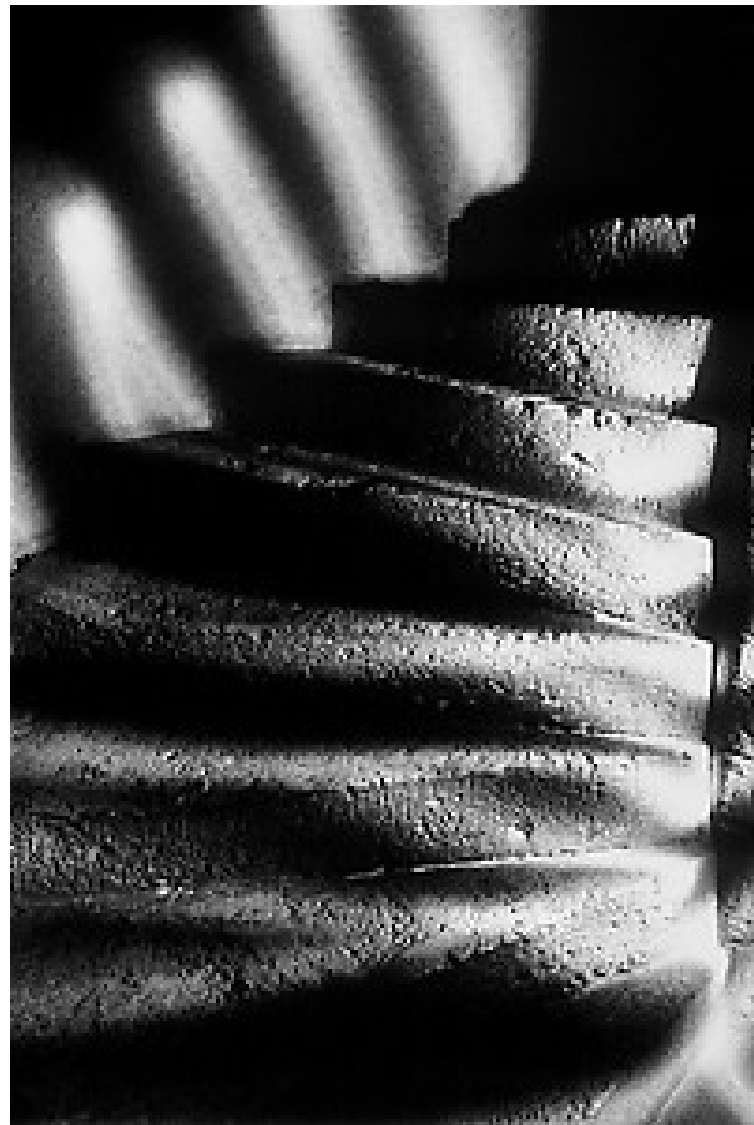
Los escalones con sombra