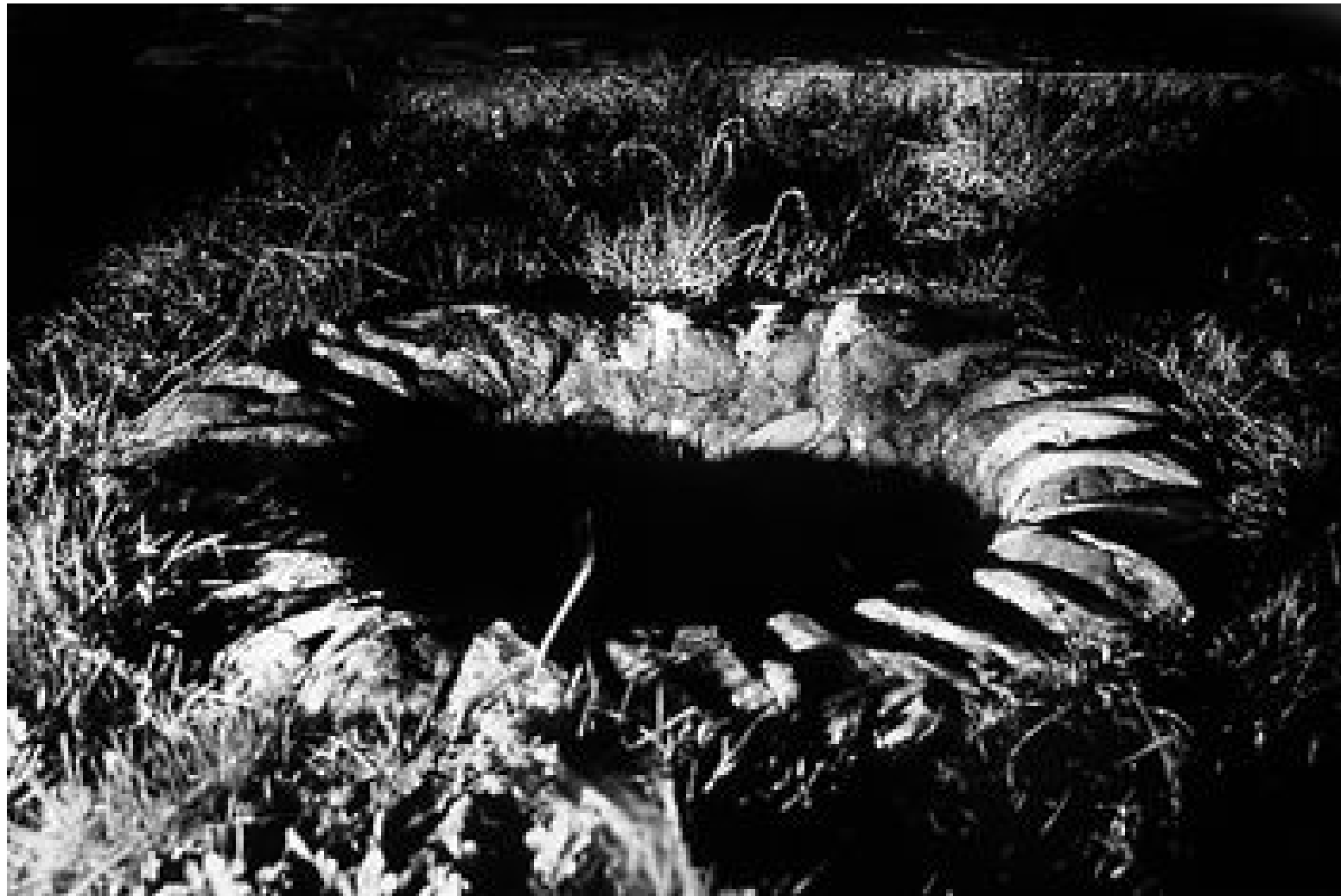
El pozo con sombras