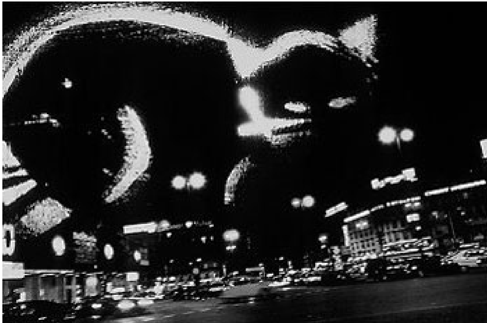
París con gato