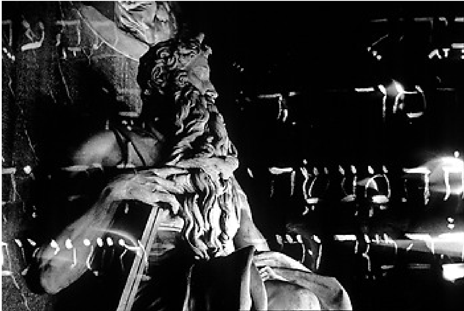
El Moisés de Miguel Angel con autógrafa