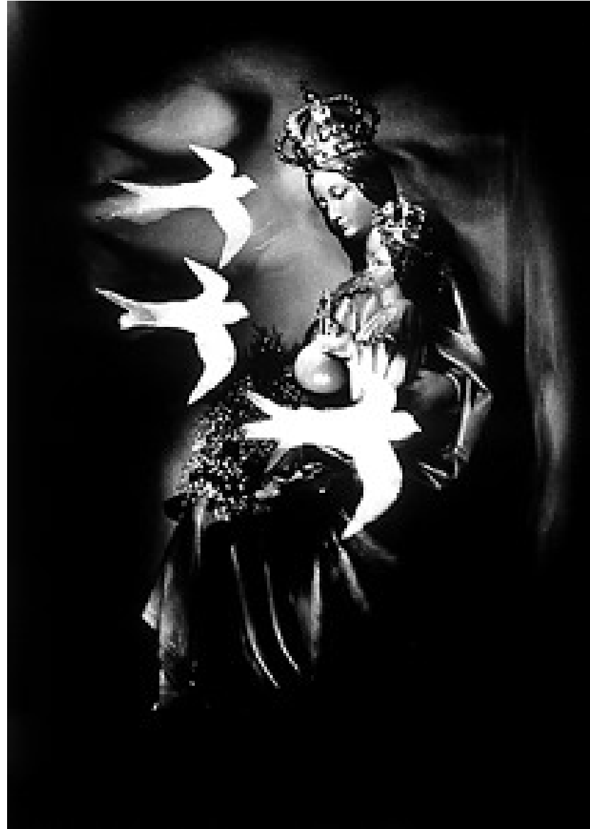
Madona con golondrinas