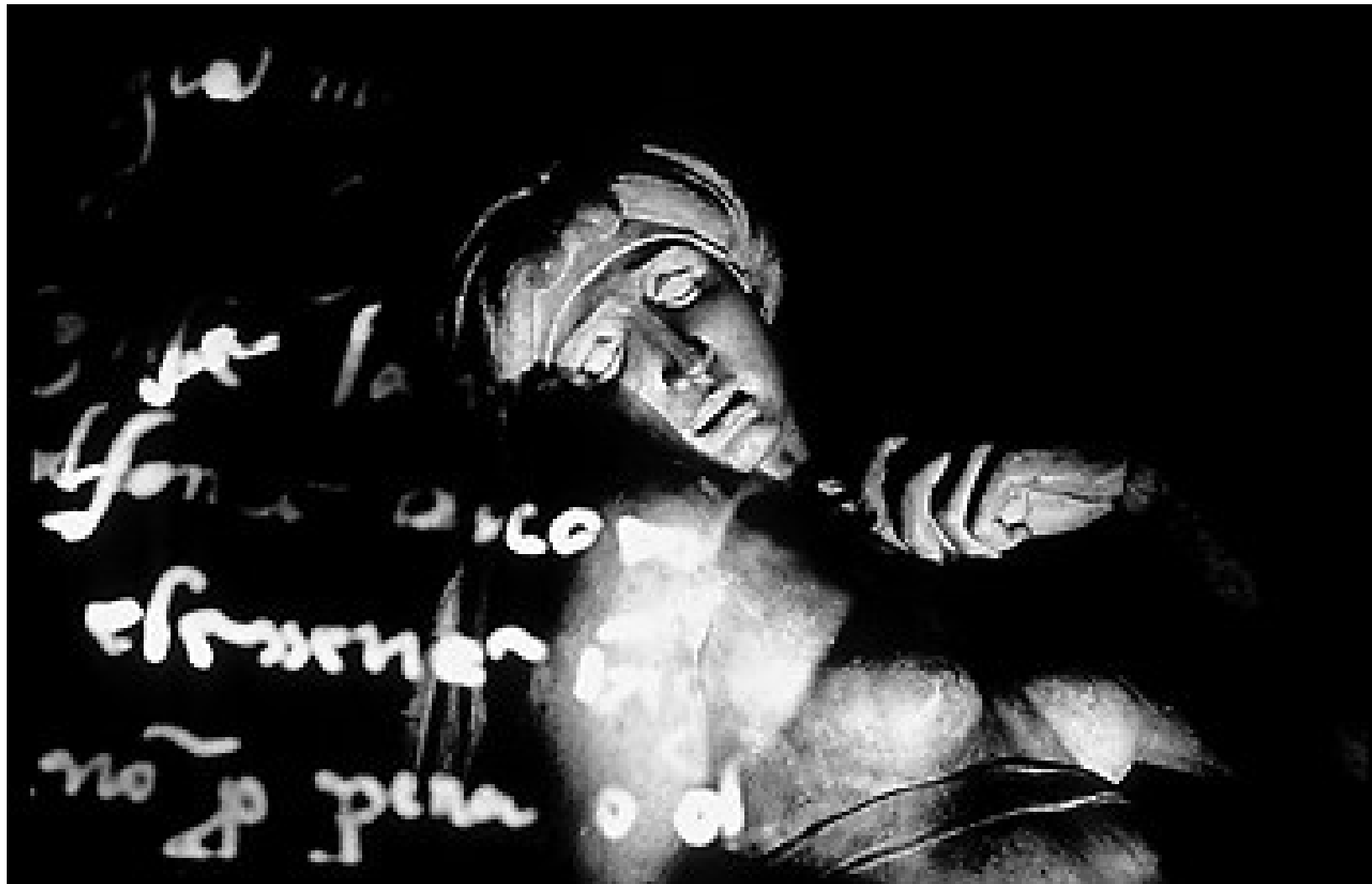
Obra de Miguel Ángel con autógrafo