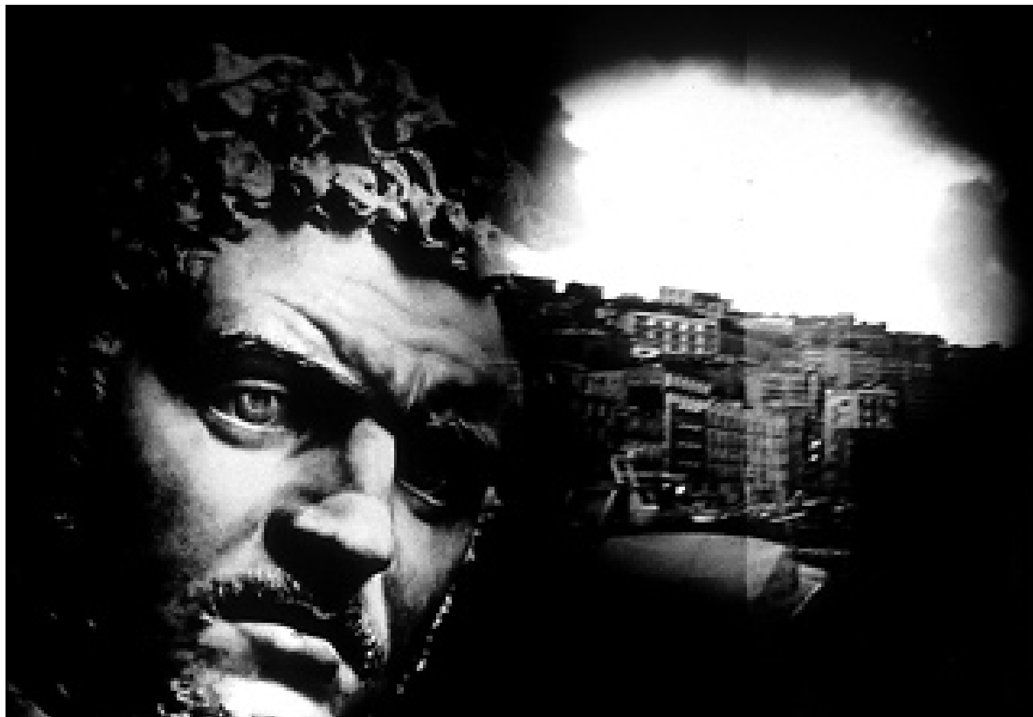
La cabeza de Calígula, Nápoles.