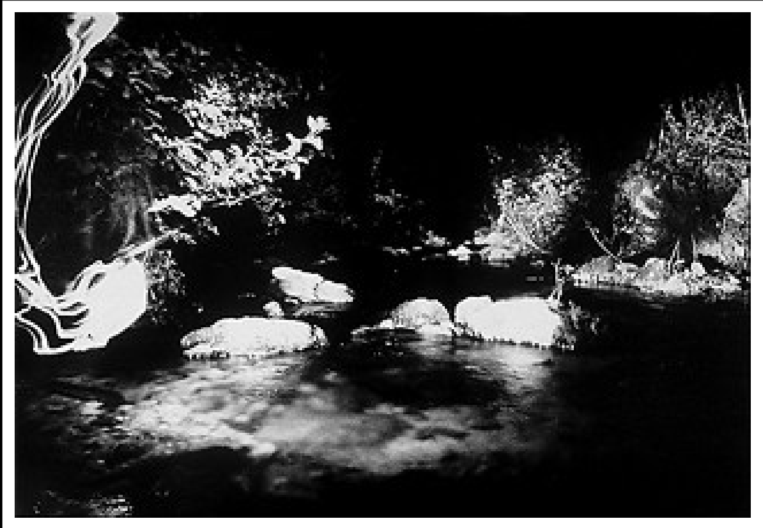
La mirada del agua