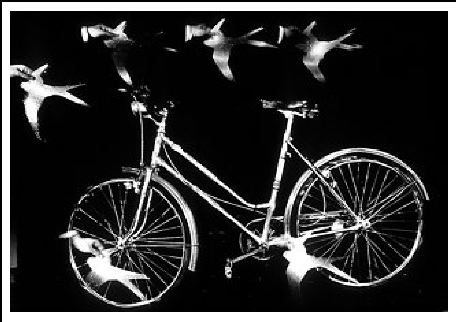
Bicicleta con golondrinas