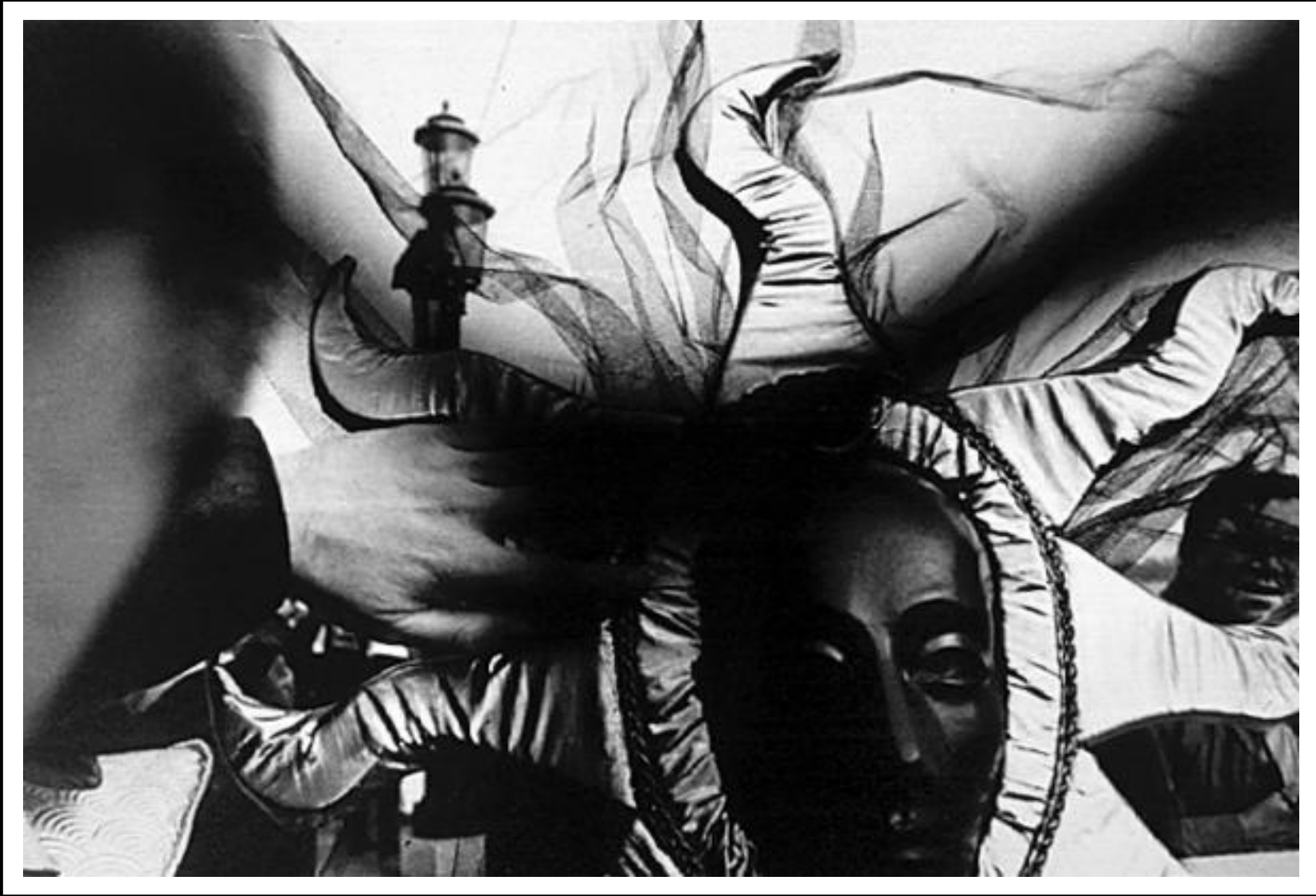
Máscaras en Venecia