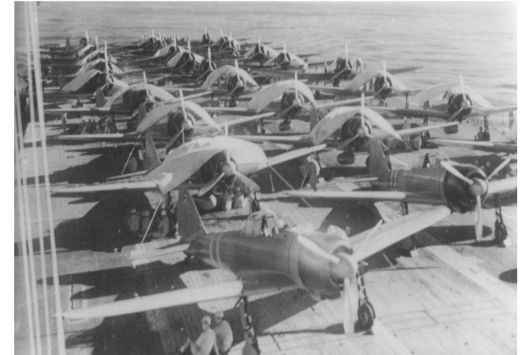
Convés do porta-aviões Zuikaku

Primeira batalha travada além do horizonte, as frotas adversárias posicionavam-se até 500km uma da outra. Muda completamente a concepção da batalha de superfície, antes centrada no couraçado com alcance médio entre 20-30km.