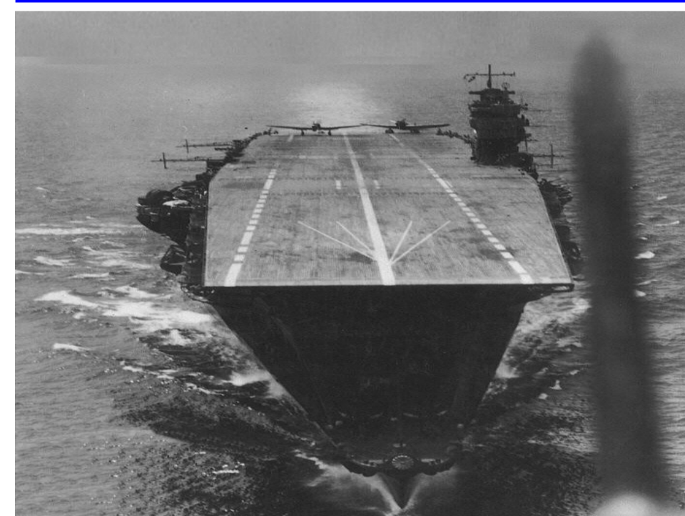
Porta-aviões japonês Akagi

Apesar do resultado desastroso para o Japão a batalha definiu o embate aeronaval como o centro da guerra naval. Após a batalha as indústrias de ambos países irão focar sua produção naval na construção de porta-aviões, apesar de apenas os EUA alcançar sucesso. O couraçado estava definitivamente superado.