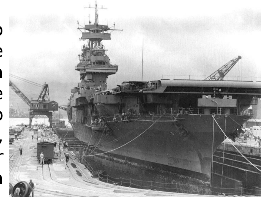
Porta aviões estadunidense Yorktown

Batalha ocorrida em junho de 1942, representou a tentativa japonesa de eliminar, em uma batalha decisiva, a força de porta-aviões estadunidense. Resultou na primeira grande derrota enfrentada pelos japoneses. Nesta batalha a Kido Butai (força aérea embarcada) japonesa foi utilizada pela primeira vez contra a força de porta aviões adversária.