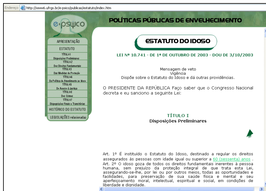
Figura 2 – Íntegra do Estatuto do Idoso

Cada um dos Títulos pode ser acessado na seqüência em que aparece no Estatuto ou cada um especificamente de acordo com o interesse do leitor. Os pontos destacados possuem links que remetem a explicações e/ou legislações específicas conforme pode ser verificado na figura 3.