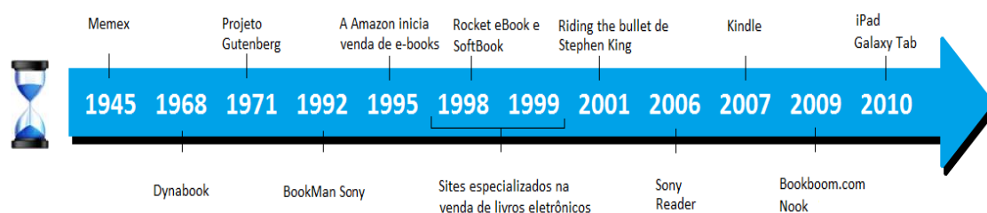
Figura 1 - Evolução do e-book

Além dos aparelhos relacionados, existem alguns projetos e protótipos que foram importantes para a evolução do livro eletrônico e merecem ser relacionados, pois apesar de não serem tão conhecidos, contribuíram para que outros aparelhos surgissem e fossem aprimorados a partir deles. São eles: Every Book Dedicated Reader, Sony Data Discman, Glass Book Reader, AlphaBook, Go Reader, Q-Reader, AONEPRO Reader, Librius - Millenium eBook, Xlibris, Cybook, eBookMan, HieBook, MyFriend, REB 1200, REB 1100. Para melhor ilustrar, a Figura 1 apresenta uma linha do tempo com os acontecimentos que influenciaram a evolução do e-book até os dias atuais.