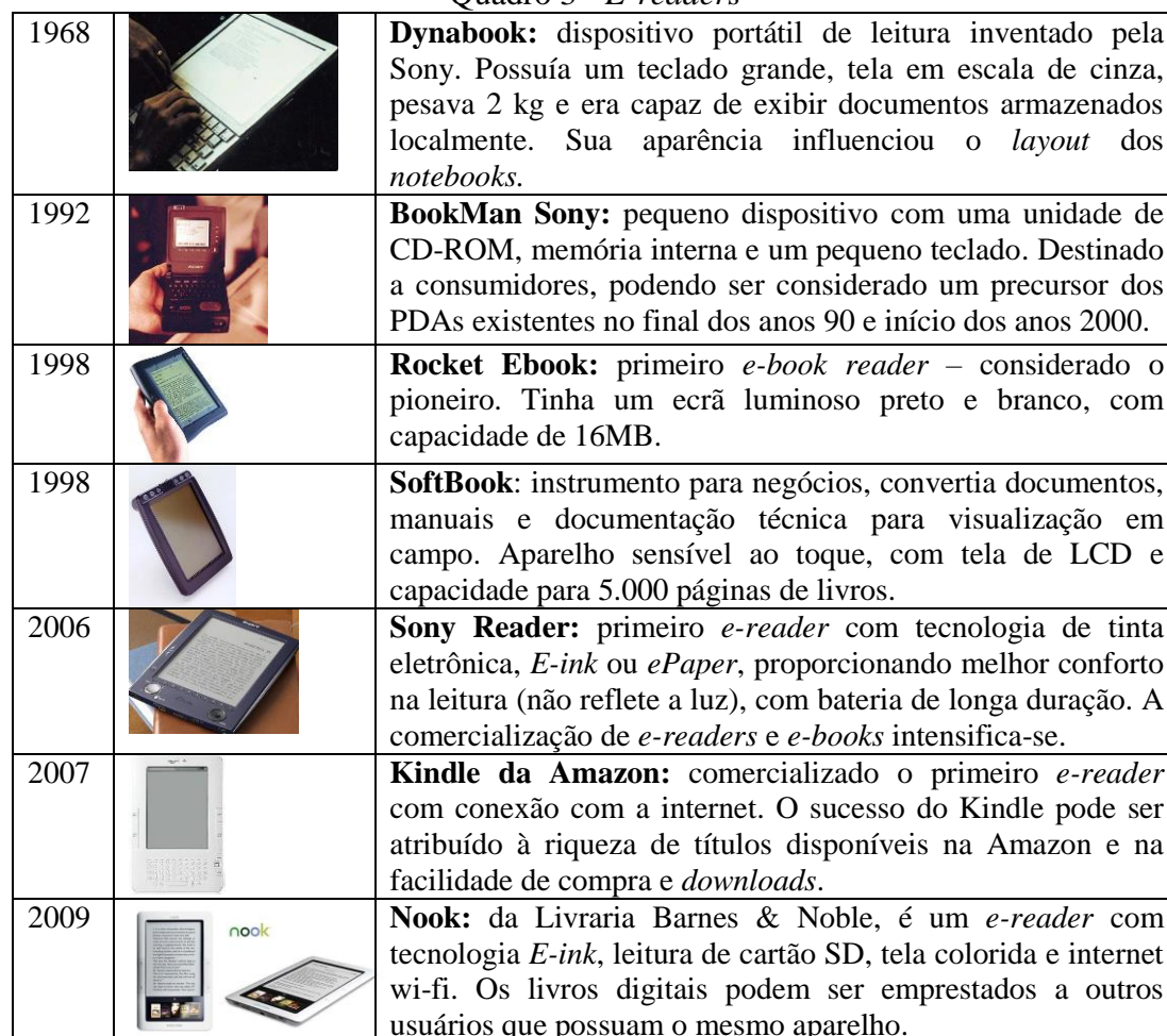
Quadro 3 - E-readers

A história dos e-books confunde-se com a história e a evolução dos aparelhos leitores. A fim de ilustrar essa evolução, a seguir elencamos alguns fatos significativos sobre e-books e dispositivos de leitura de acordo com sua importância histórica e pioneirismo (Quadro 3).