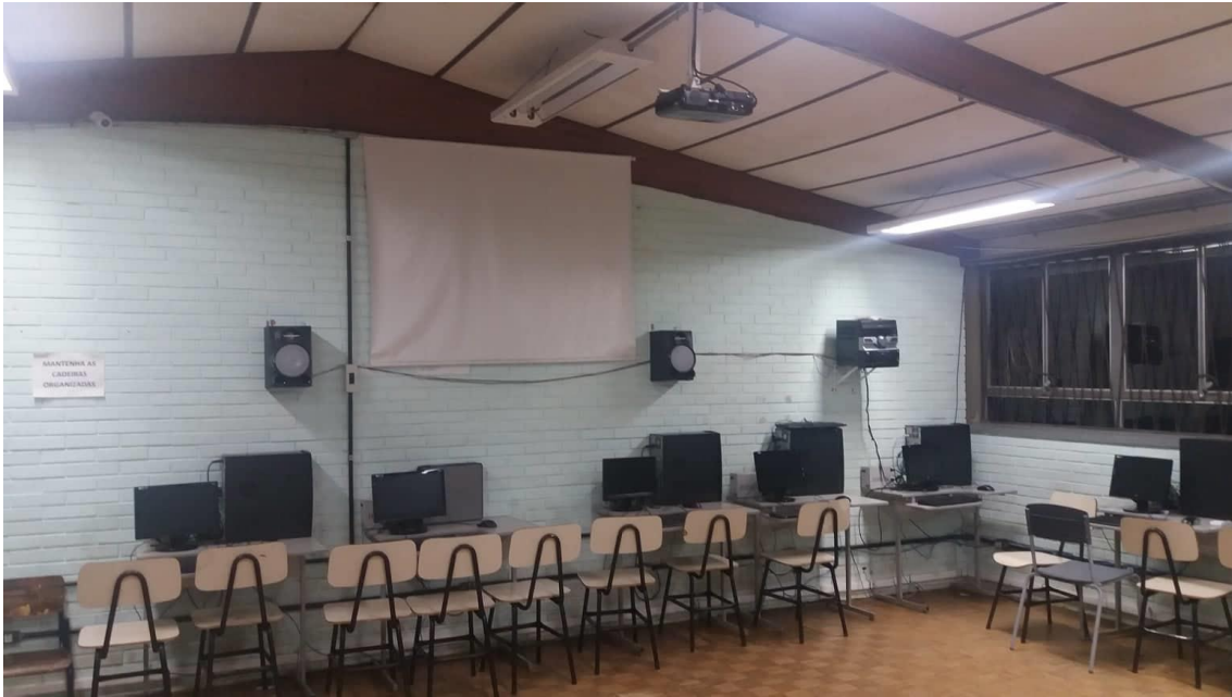
Figura 4 – Laboratório de informática e de projeção.

Um dos fatores que proporcionou a realização desse estudo na prática foi à existência do acesso à internet e às tecnologias e ferramentas digitais em todas as escolas na qual foi aplicada esta prática. Porém, como acontece na maioria das escolas, os laboratórios de informática são utilizados por todas as turmas da escola, o que proporciona esta possibilidade de acesso a toda comunidade escolar, mas que ao mesmo tempo, necessita de uma organização prévia muito eficaz, cronogramas pré-estabelecidos e o cumprimento das normas de utilização desses destes espaços. Logo, a organização e o planejamento das atividades se tornam essencial para execução do mesmo e faz parte do que chamamos de infraestrutura de execução de projetos em espaços comuns a utilização da comunidade escolar.