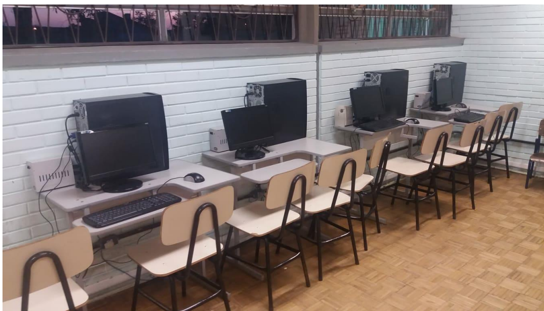
Figura 1 – Laboratório de informática de uso dos alunos.

As imagens abaixo mostram as dependências e salas para uso de tecnologias e acesso à internet nas escolas onde estudo foi realizado.