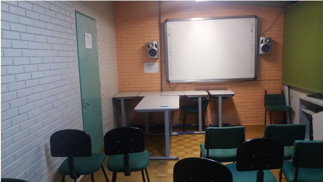
Figura 2 – Sala multimeios – Lousa digital.