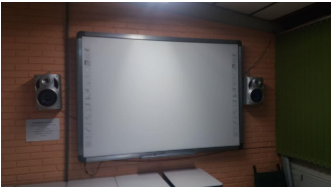
Figura 3 – Sala multimeios – Lousa digital.