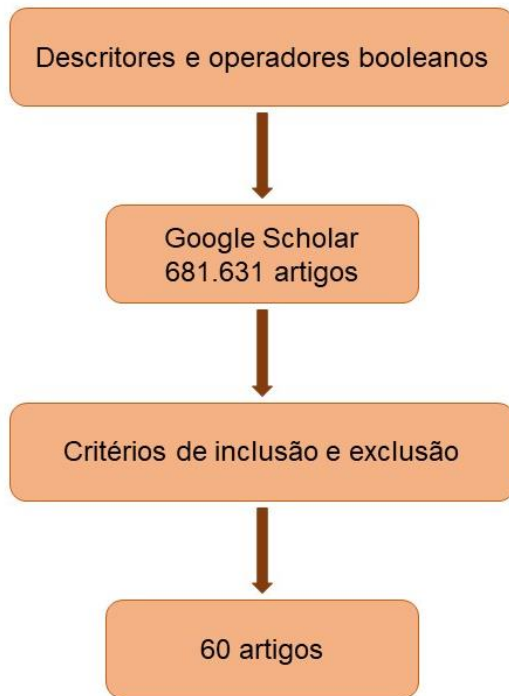
Figura 1 – Estratégia de busca de referências bibliográficas