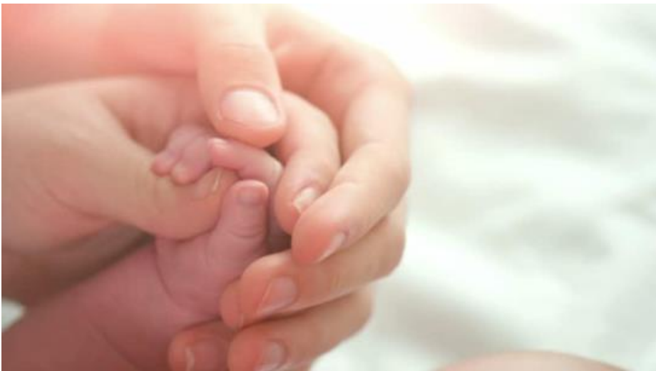
Figura 3 – Representação do sentimento de um casal que deseja ter filhos