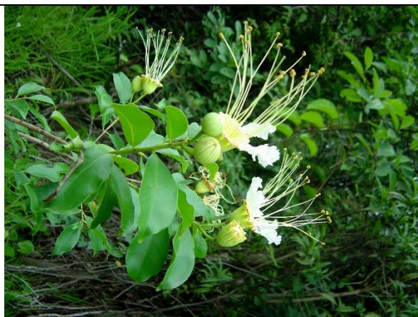
Lafoensia nummularifolia - Ramo com folhas e flores