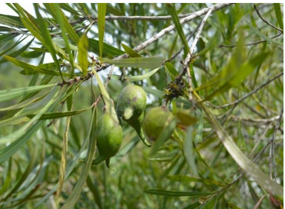
Pouteria salicifolia – Ramos com folhas e frutos