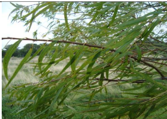
Salix humboldtiana – Ramos com folhas