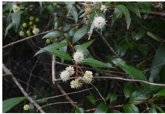
Cephalanthus glabratus - Ramos com folhas e flores