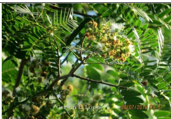
Albizia inundata – Ramo com flohas e flores