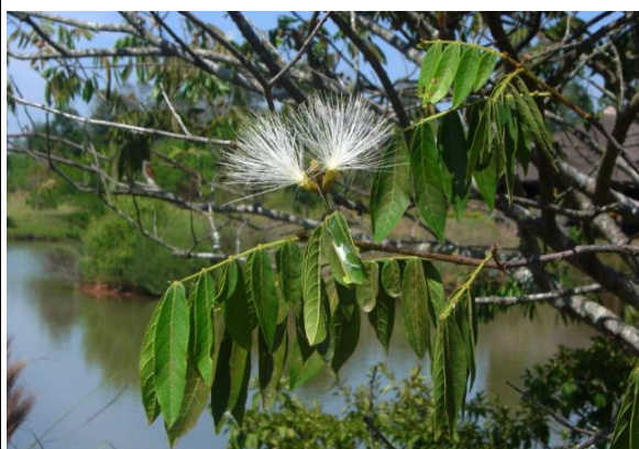
Inga vera - Ramo com folhas e flores