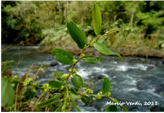
Phyllanthus sellowianus - Ramos com folhas e flores