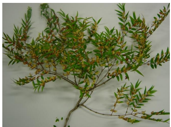
Callistene inundata – Ramos com folhas e flores