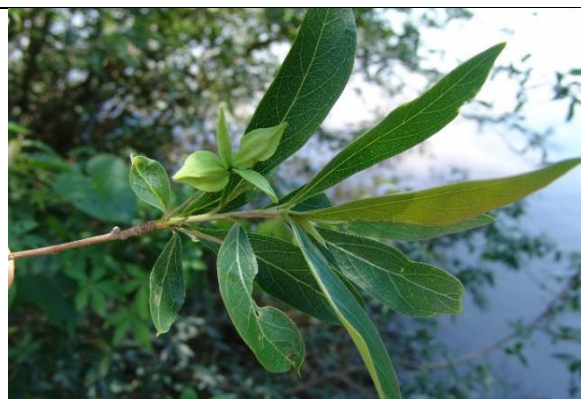
Terminalia australis - Ramo com folhas e frutos

Figuras sobre as reófitas arbóreas e arbustivas exclusivas do Rio Grande do Sul citadas no presente trabalho.