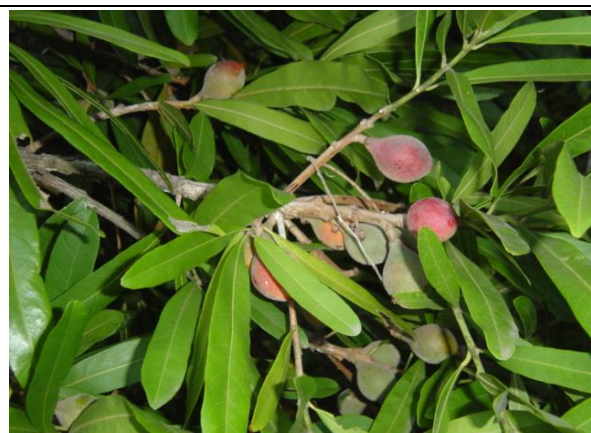
Pouteria gardneriana – Ramos com frutos