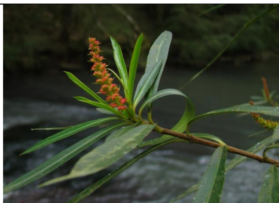
Colliguaja brasiliensis