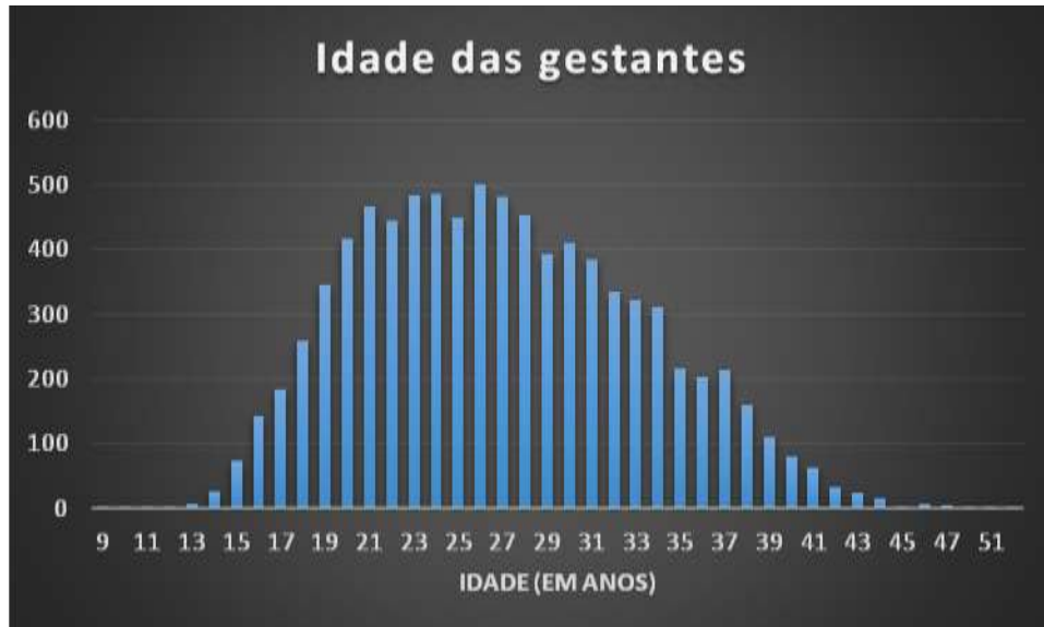
Gráfico 1 - Histograma de distribuição da variável idade das gestantes vivendo com HIV em Porto Alegre.

Em relação à escolaridade, houve uma concentração de mulheres com 4 a 7 anos de estudo (49,6%); seguido de 28,4% de mulheres com 8 a 11 anos de estudo. Apenas 8,8% das mulheres investigadas no estudo possuíam 12 anos ou mais de escolaridade (Gráfico 2).