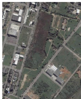
Figura 2- Parque Humaitá 11

Internamente, o que poderíamos chamar de ala sul do parque conta com playground , uma quadra de vôlei de praia e campos de futebol; na parte central, localizam-se a administração do parque, alguns quiosques cobertos (churrasqueiras), e um playground . Na ala norte, há quadras polivalentes, campos de futebol de areia e grama, uma sala para atividades múltiplas 12 e uma cancha de bocha, atualmente desativada, com previsão de reconstrução 13 . Nesse mesmo setor, há, ainda, um campo de futebol com dimensões oficiais, o qual tem uma arquibancada numa das suas laterais.