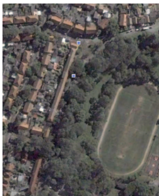
Figura 3 - Parque Alim Pedro 19

promove diversas atividades, entre as quais as escolinhas de futebol, de futsal e de vôlei e de basquete; aulas de alongamento e de ginástica; atividades e eventos recreativos direcionados a crianças e portadores de deficiência física 20 . O parque também serve de espaço para a realização de atividades autonomamente organizadas por moradores do bairro como, por exemplo, as oficinas de desenho e de pintura, os encontros beneficentes, campeonatos de futebol do bairro, os jogos de bocha, e até missas campais 21 .